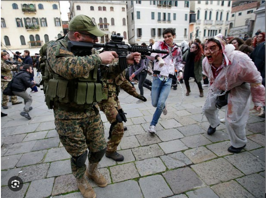
Nicht als Witz entworfen": US-Soldaten trainieren für Zombie-Apokalypse - n-tv.de