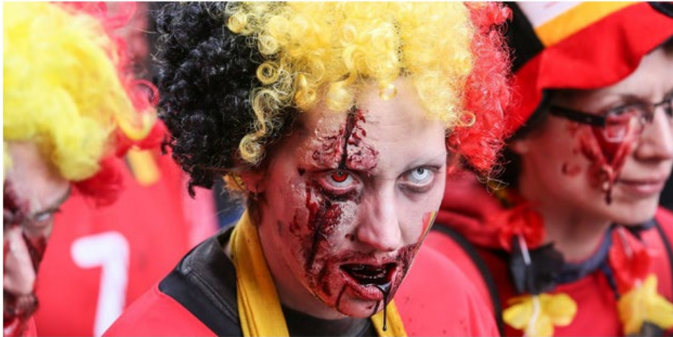
Ein möglicher Gegner der US-Armee.

Der Führungsnachwuchs des US-Militärs muss auf alle Situationen reagieren können. Auch auf einen Zombie-Angriff. Der „Conplan 8888“ bereitet sie darauf vor.