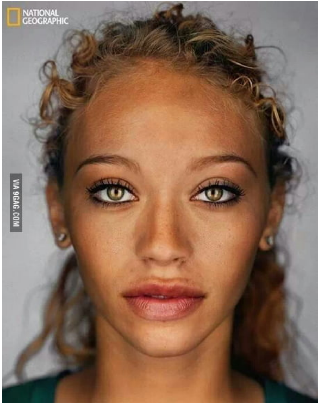
Transhuman-Modell 2050