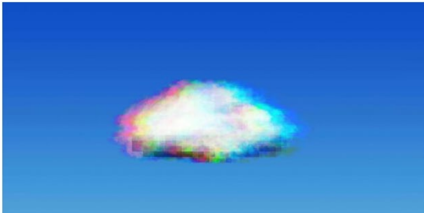
Grenzenlos ist das Wissen des Chatbots aber nicht

Eine KI, die für uns Texte schreibt? Klingt toll. Und ist inzwischen Wirklichkeit. ChatGPT ist lustig, eloquent – und gefährlich.